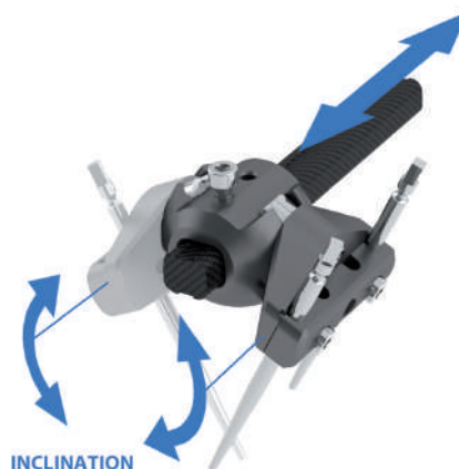
Configurazione Standard: Adattatore Barra-Morsetto con una (o due) Base-Morsetto