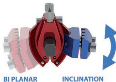
Montaggio Bi-planare con inclinazione

Combinando le componenti modulari del fissatore FIXUS66 è possibile realizzare le seguenti configurazioni: Mono-planare, Bi-planare, Movimento 3D completo, Inclinazione e assemblaggi multipli.